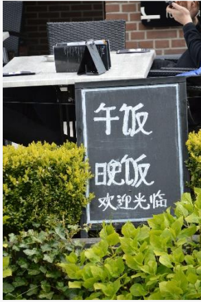
Bord in Giethoorn (vertaling: lunch en diner: welkom!)